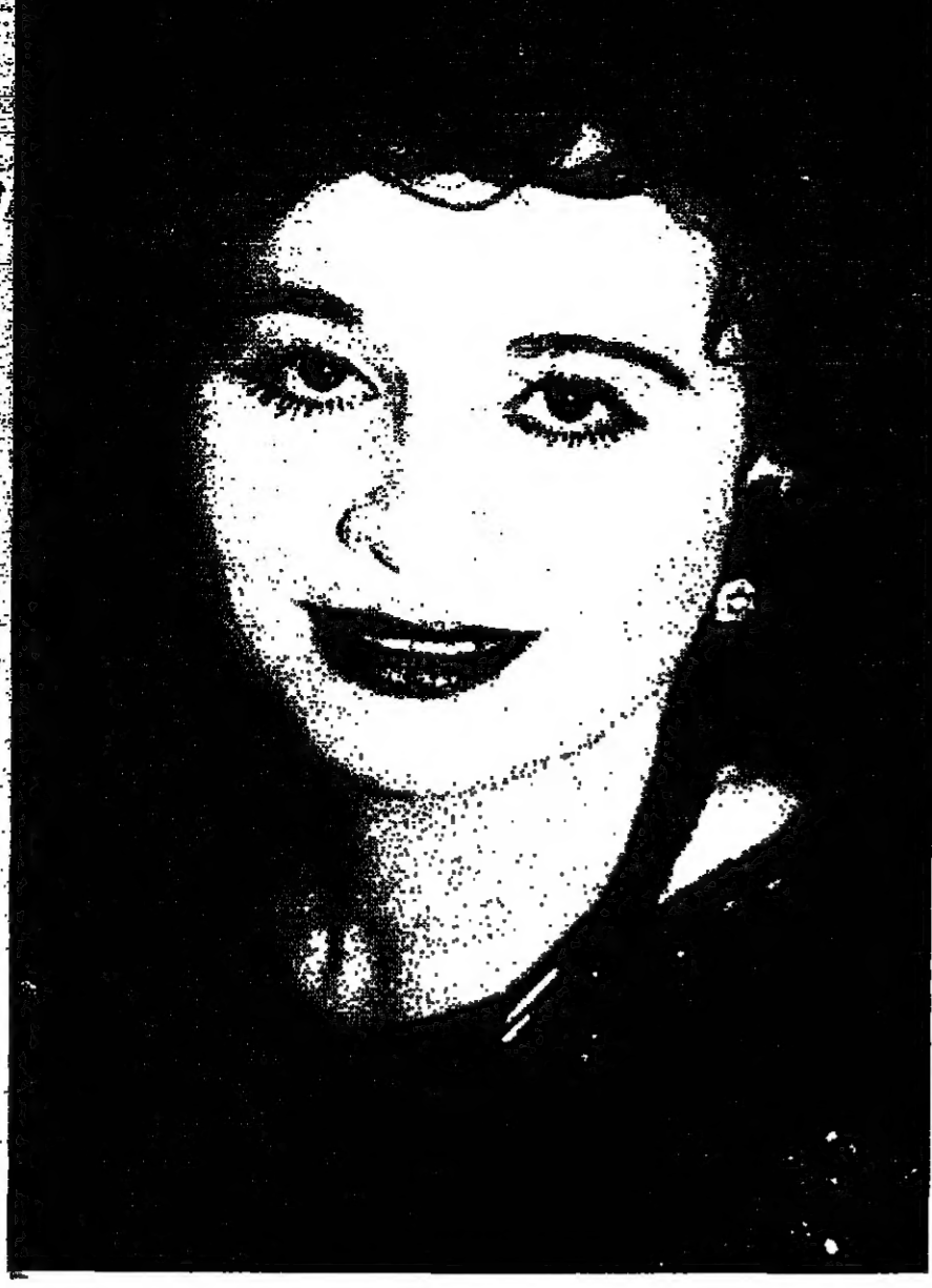
إلهام شاهين (القدس العربي)

ان تقدم فيلمين عن أم كلثوم ظاهرة صحية لانها سيدة عظيمة حيث لعبت دورا مهما على المسارين الفني والسياسي. علاقة أم كلثوم بعبد الناصر كيف سيناقشها الفيلم؟ أم كلثوم اول من غنت للثورة ولانجازاتها الكبيرة واول من دعمتها بفناتها ولا شك ان هناك جزءا كبيرا في الفيلم يتناول علاقة أم كلثوم بالثورة وقادتها ناصر كما يطرح الفيلم مفاجأة وهي الاغنية التي غنتها أم كلثوم عقب سماعها نيا وفاته وهذا الاغنية بعنوان «عندي سؤال اليه» وبالاسف لم تنج الا لفترة قصيرة في اعقاب رحيل ناصر.